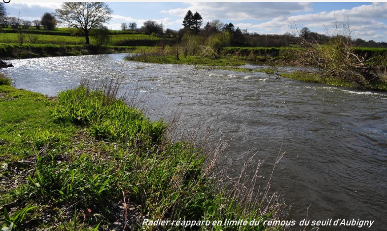
Radier réapparu en limite du remous du seuil d'Aubigny

et bien sûr, au patrimoine aquatique naturel, dont la faune qui retrouve des habitats originels et ne dépense plus d'énergie supplémentaire pour traverser le site.