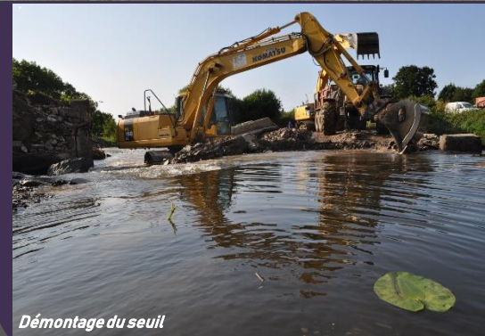
Démontage du seuil