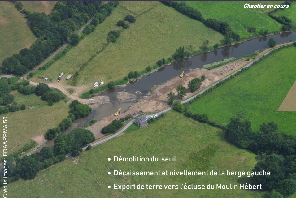
Chantier en cours