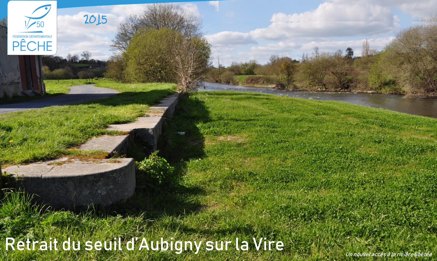
Un nouvel accès à la rivière libérée