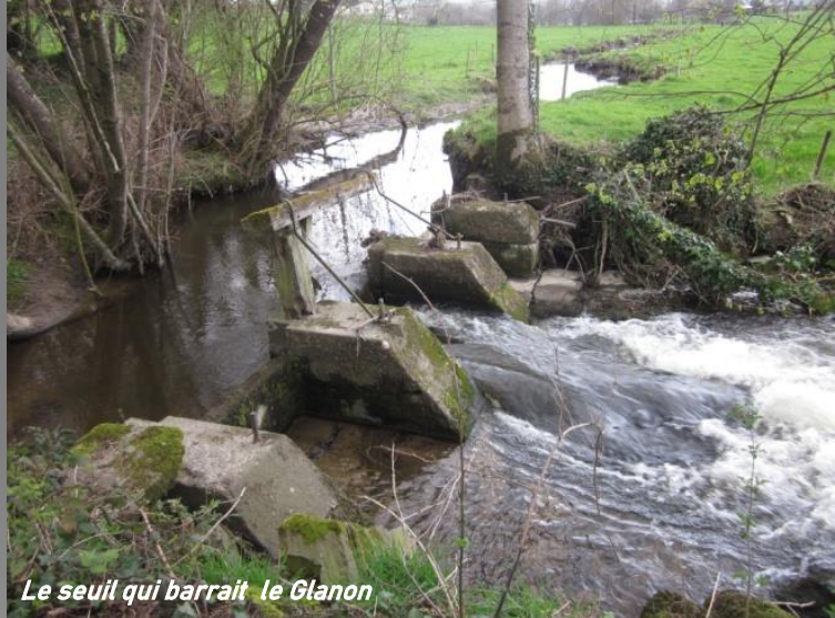
Le seuil qui barrait le Glanon

La meilleure solution était de retirer l'ouvrage et d'embellir les berges alentour, les relier au halage..