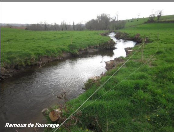
Remous de l'ouvrage