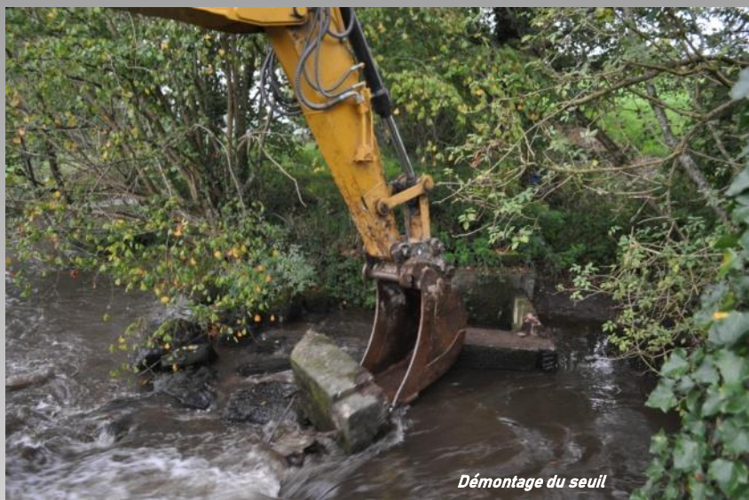
Démontage du seuil