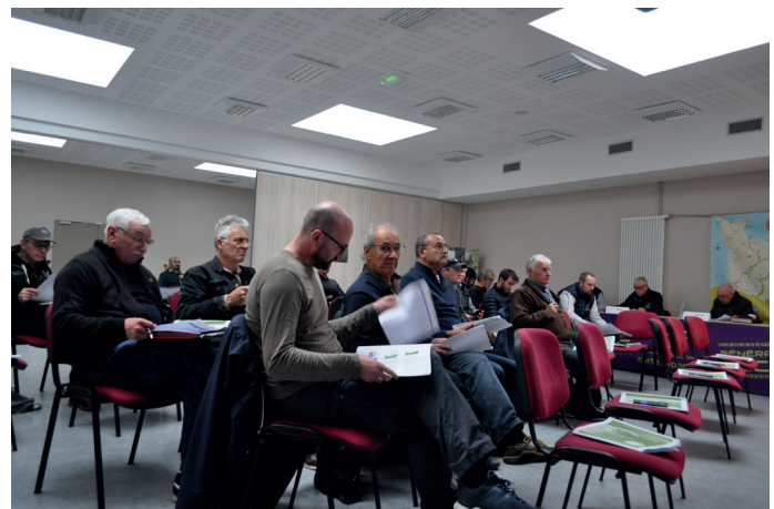
Les présidents des AAPPMA du département

L'ordre du jour se composait du bilan de la vente des cartes de pêche de la saison 2023, le prix des cartes de pêche 2024, les missions et actions réalisées et à venir, les vœux émis par les AAPPMA pour l'arrêté préfectoral 2024 (nombre de truites autorisées, pêche no-kill, étude brochet ??...)