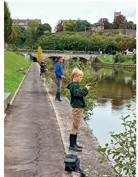
Participants du stage pêche des carnassiers du bord

Les deux jours de stages ont permis d'approfondir ces techniques et de prendre le temps de se perfectionner.