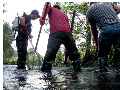
Prospection IAS 2023

La tendance nationale est assez préoccupante.