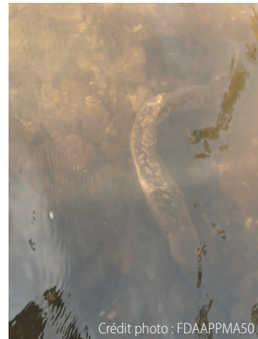
Exemple de frayère à Lamproie Marine