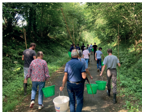
Découverte de la pêche des écrevisses

Les animations pêche au coup, pêche des écrevisses et pêche aux leurres ont remporté un vif succès auprès des vacanciers et de ceux qui souhaitent découvrir la pêche.